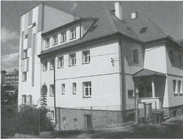
Vlčí vrch 323, Liberec 15

Kontrolu za účasti ředitelky organizace Bc. Vladimíry Řáhové provedly: