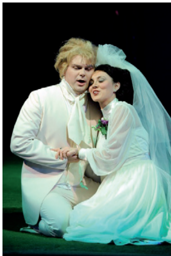
Náměsíčná. Opera v podání souboru F. X. Šaldy měla úspěch.

Liberecká opera slavila velký úspěch v evropských městech. Vojtěch Havlík