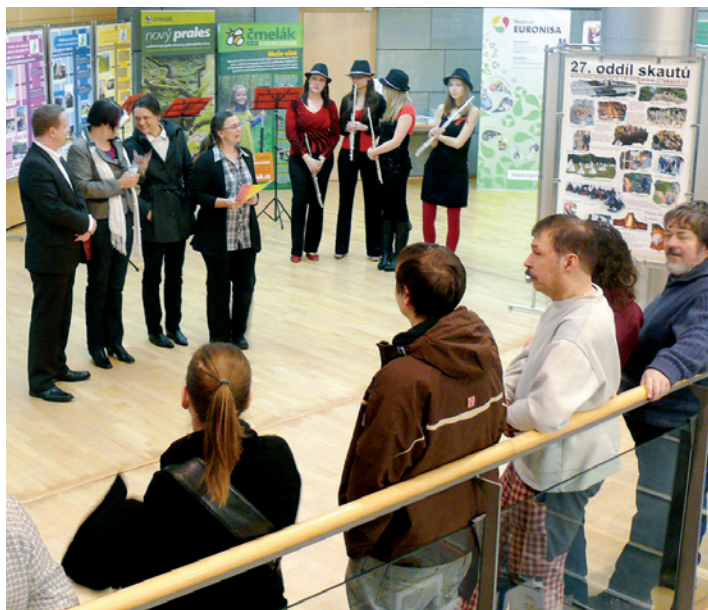
Dobrovolnictví = motor občanské společnosti. Snímek z vernisáže výstavy v Krajské vědecké knihovně 3. února.

Hlavní důvod je prostý. Podpořit rozvoj kvalitní občanské společ-