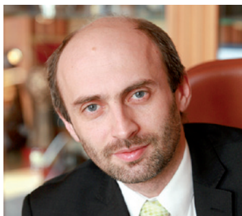
Primátor Liberce Jan Korytář.

Jaké podmínky by měla splňovat nová výstavba, aby nezhoršovala kvalitu bydlení lidí, kteří v lokalitě již žijí? Kudy mají vést nové silnice či tramvajové tratě, pokud se je město rozhodne v budoucnu vybudovat? Kolik zeleně, jaké a kde potřebujete pro to, aby se v Liberci dobře žilo? Kudy mají vést nové cyklostezky? Jaký prostor