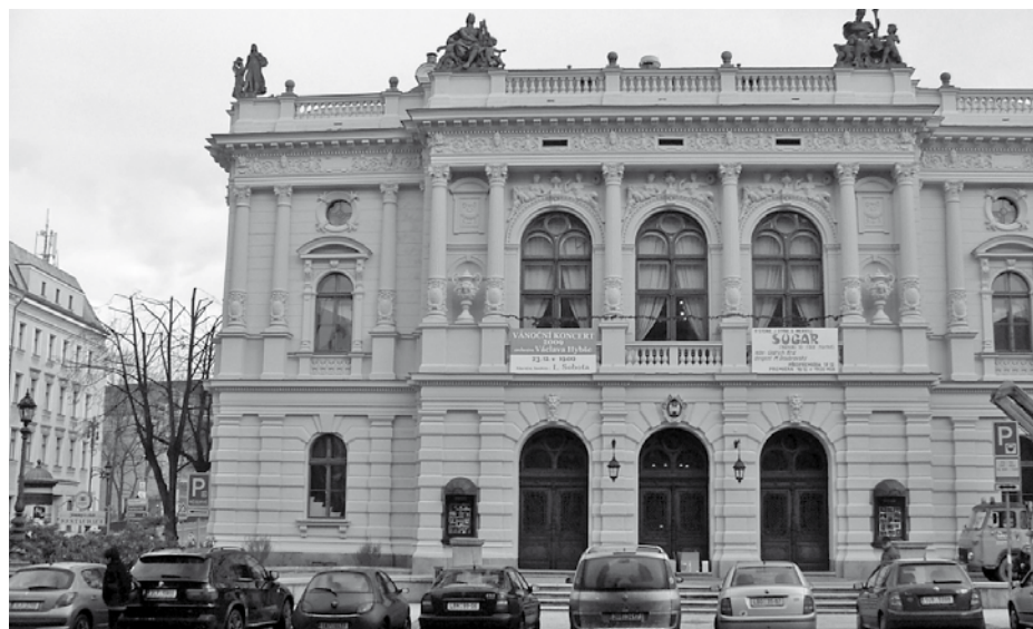
Divadlo F. X. Šaldy získalo v loňském roce nový vzhled, a to opravou a nátěry fasády. Opraveny byly kartuše a došlo i na výměnu osvětlení.

Kdo ví, ať odpověď pošle na mic@infolbc.cz nebo doručí přímo do MIC Liberec do 21. 1. Výherce zveřejníme v následujícím čísle.