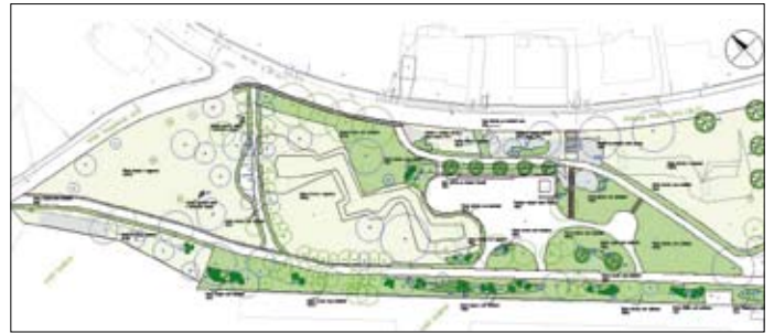
Park Prokopa Holého

osvětlení. Park Prokopa Holého o rozloze cca 9 600 m 2 se dočká zeleně (prořezávky, výsadba nové apod.), rekonstrukce perkové komunikace, chodníků, instalace slunečních hodin, rekonstrukce multifunkčního hřiště, instalace nového mobiliáře, instalace herních prvků, vybudování gabionové stěny a rekonstrukce schodiště. (DS)