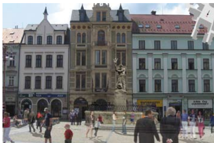
Neptunova kašna na nám. Dr. E. Beneše

Mezi nimi je například umístění Neptunovy kašny zpět na náměstí Dr. E. Beneše. Liberečany tolik oblíbená budova bývalých Městských lázní rovněž projde změnami. Cílem tohoto projektu je revitalizace lázeňského objektu dle požadavků kladených na moderní galerijní prostory, splňující požadavky na dlouhodobé i krátkodobé výstavy a doprovodné aktivity, které bude provozovat zejména partner projektu – Oblastní galerie v Liberci. Projekt sestává z rekonstrukce budovy městských lázní a novostavby přílehlého depozitáře. K hlavním výstupům projektu patří vytvoření prostor pro stálé expozice a proměnné výstavy, přizpůsobení prostor přehlednému a bezbariérovému pohybu mezi expozicemi, provozní zázemí galerie (pokladna, informace, šatny, kavárna, knihkupectví, toalety, dětský koutek, administrativní prostory, lektorské prostory, depozitář, ostraha, dílna, fotoateliér aj.). Realizace projektu povede ke zvětšení výstavní plochy určené pro stálé expozice, což umožní vystavit i díla dosud kvůli nedostatku prostor ukrytá v depozitářích.