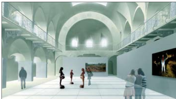
Revitalizace Městských lázní

Vedení statutárního města Liberec v čele s primátorem Jiřím Kittnerem v letošním roce odstartuje několik akcí, které změni tvář stotisícového města pod Ještědem, přispějí k jeho dynamice i lepšímu životu jeho obyvatel. Jde o prioritní projekty financované z fondů Evropské unie.