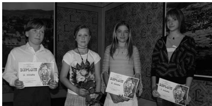
Část oceněných autorů výtvarných prací

Hlasování v anketě Hledáme liberecké poklady pokračuje na www.liberec.cz . (S,H)