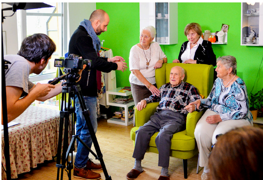
Aktéry videoklipů zaměřených proti pochybným podomním prodejcům nebo podvodníkům byli herci Divadla F. X. Šaldy a liberečtí senioři. Reportáž z natáčení najdete na straně 21.

Videoklipy zaměřené na praktiky podvodných prodejců jsou dalším trumfem, který město Liberec vytáhne v boji proti šmejdům. Natáčení pod taktovkou týmu Divadla F. X. Šaldy a Komunitního střediska Kontakt probíhalo v libereckých domech s pečovatelskou službou.