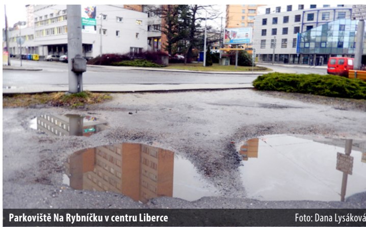
Parkoviště Na Rybníčku v centru Liberce