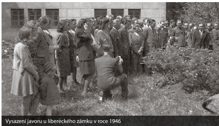
Vysazení javoru u libereckého zámku v roce 1946