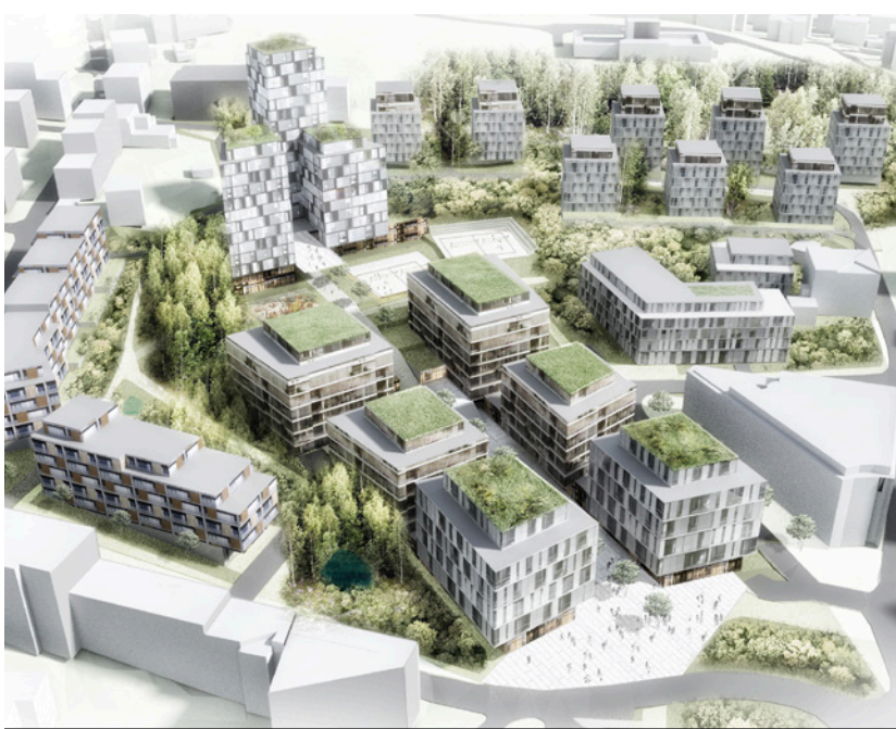
Zástavba na Novém Perštýně

S ohledem na skutečnou náročnost těchto částí byly zbylé dva projekty odpočinkem a klidným dumáním nad architekturou a urbanismem. U projektů viladomů v lokalitě Vesec se projevila nutnost budoucí spolupráce technické univerzity