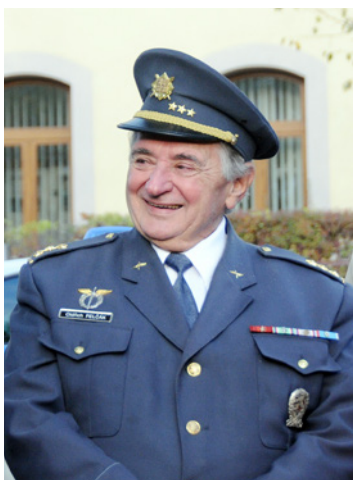
Vysazení Lípy republiky byl přítomen i pplk. letec kosmonaut Oldřich Pelčák.

V letošním roce, a právě v říjnu, je to plných 100 let od okamžiku, kdy vznikl samostatný stát Čechů a Slováků, tedy Československá republika. Nejvýznamnější dějinný okamžik dvou sobě nejbližších slovanských národů tak bude pro další generace připomínat právě na tomto místě symbolický národní strom.