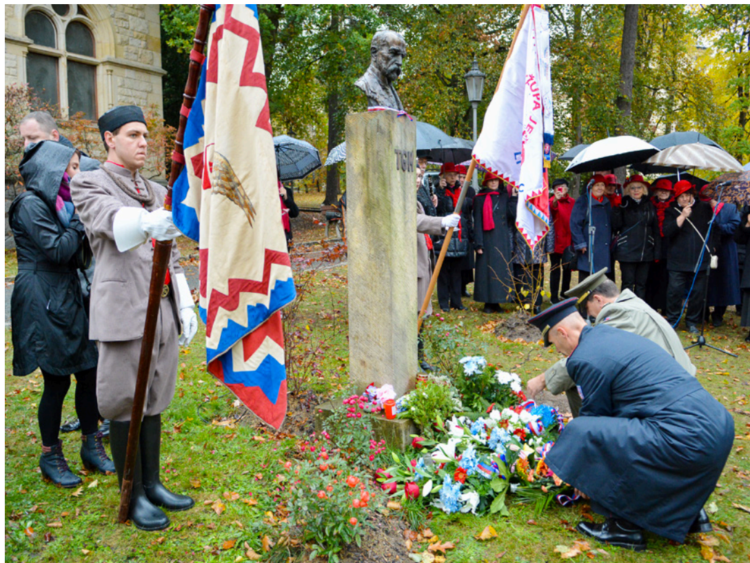
V rámci 100. výročí vzniku samostatného československého státu se v neděli 28. října odpoledne konalo vzpomínkové shromáždění u pomníku T. G. M. v Masarykově ulici. Tomu předcházelo vysazení Stromu republiky v parku Clam-Gallasů. Více na straně 10.

Výročí vzniku Československé republiky si Liberečané připomínali v neděli 28. října hned na několika místech města.