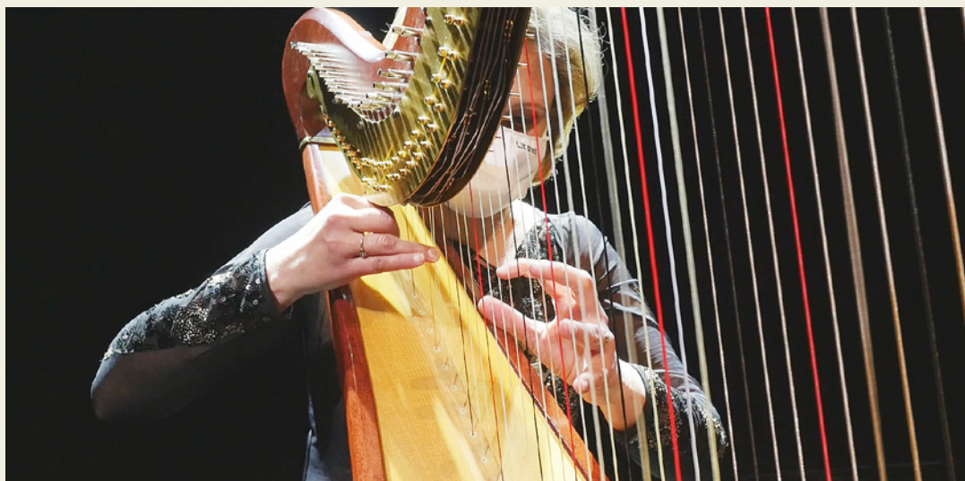
Divadlo F. X. Šaldy

Divadlo F. X. Šaldy již druhý měsíc připravuje online program, díky kterému tak zůstává v kontaktu s diváky i v době koronavirové pandemie. Přímé přenosy a všechny reprízy programu Divadla online je možné sledovat zdarma jak na YouTube kanálu, tak na facebookovém profilu DFXŠ, a nově i na webové platformě www.saldovo-divadlo.cz .