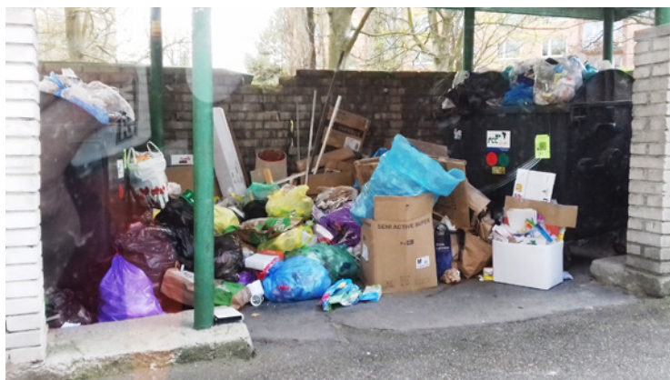
Odbor ekologie a veřejného prostoru

Svoz komunálního odpadu je jednou ze základních služeb města, kterou pro své obyvatele zajišťuje. Většina lidí již tuto službu považuje za natolik automatickou, že si ani nepřipouští, že by situace mohla vypadat i jinak.